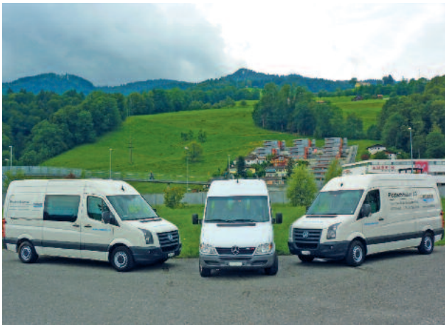
Unsere Servicetechniker sind für Sie mit komplett ausgerüsteten Servicefahrzeugen in der gesamten Schweiz im Einsatz.