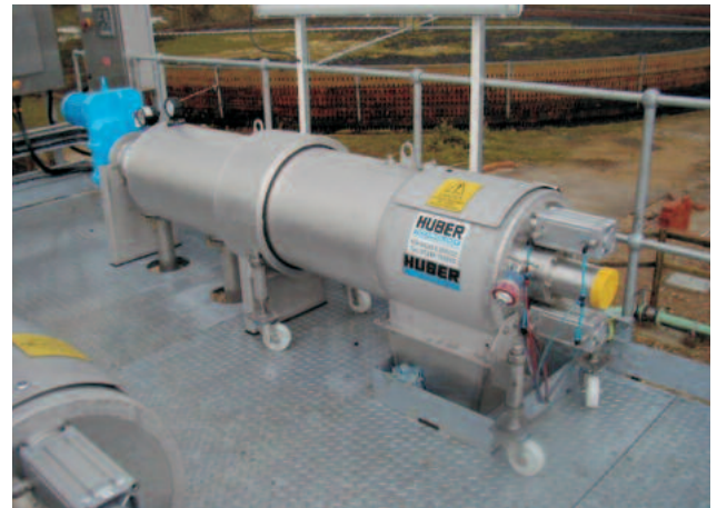
STRAINPRESS®: Revisionen und Aufbereitung von Schneckenwellen für hohe Standzeiten