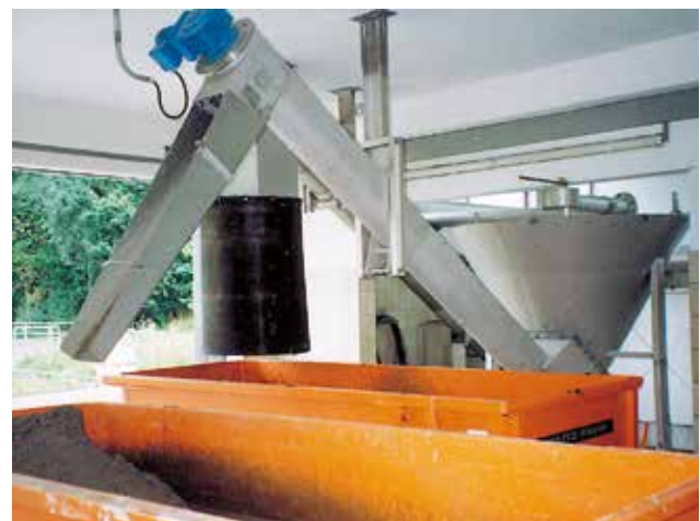
Eine Klassierschnecke transportiert das abgeschiedene Sandfangmaterial aus dem Abscheideraum in den Container.