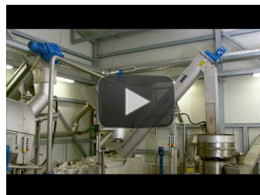
Video: HUBER Sandaufbereitungsverfahren RoSF5 auf der Kläranlage Frankfurt-Niederrad https://www.youtube.com/watch?v=nlufMzRyK4A