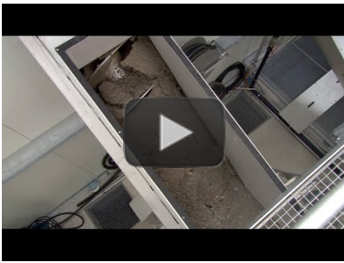
Video: HUBER Sandaufbereitungsverfahren RoSF 5 in der Entsorgungsindustrie https://www.youtube.com/watch? v=QM5e-dyKnRo